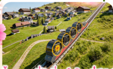
ชั้นรางที่ชันที่สุดในโลกสู่สตูล

พีชียอดเขาชวนเนกกา 1 ในเขาที่สวยงามที่สุดเมืองเซอร์แมท