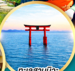
ทะเลสาบบิวะ เสาโทริอิ

เส้นทางสายอัลไพน์ทากายามา กำแพงหิมะ เขื่อนคุโรเบะ