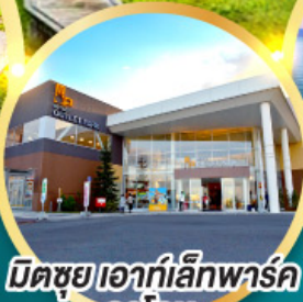
มิตซึยะ เอากอล์ฟพาร์ค คาโดมะ