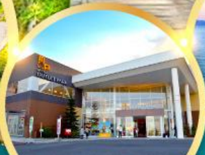
มิตซึยะ เอาท์เล็ตพาร์ค คาโตะมะ