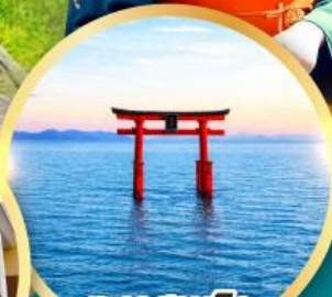
ทะเลสาบบิวะ เสาโทริอิ

เส้นทางสายอัลไพน์ทาเคยาม่า กำแพงหิมะ เขื่อนคุโรเบะ