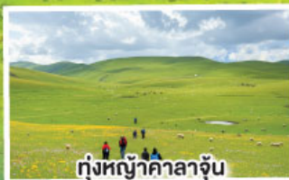
ทุ่งหญ้านาคาลาจูน