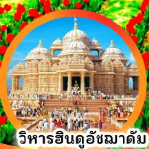
วิหารฮินดูอัชมาดัม