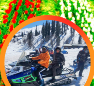
ขี่ SNOW MOBILE