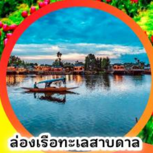
ล่องเรือทะเลสาบตา