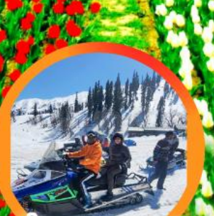
ขี่ SNOW MOBILE