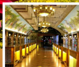
พิพิธภัณฑ์ไวน์ชิงเต่า