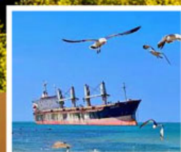
เรือสินค้าก่ายตันบลูวิส