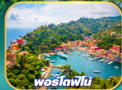
พอร์โตฟิโน