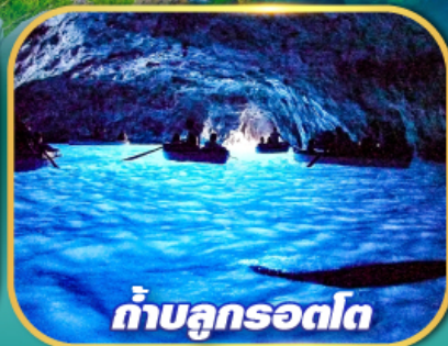
ถ้ำบลูกรอตโต