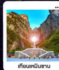
เกียนเหมินซาน