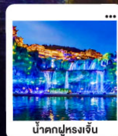
น้ำตกฝูหลงเจิน

"มหัศจรรย์...จางเจียเจีย" | ดินแดนแห่งขุนเขาและสายน้ำ "เขาเทียนเหมินซาน" | ประตูดวง...ทำกายศรึกษา 999 ชั้น | นั่งรถไฟความเร็วสูง สัมผัสความสวยงามตระการตา "อุทยานอวตาร" | ส่องล่องกลางขุนเขา...ดั่งภาพฝันในห้วงจินเจียเจีย | ซุปปัง POPMART "เมืองโบราณ"ฝูหลง" หยุคเวลา ณ เมืองบนม่านน้ำตก... | "เฟิงหวง" ส่องเรือชมชีวิตริมแม่น้ำกิวเจียง "นครอางซา" ปิดท้ายความทันสมัย