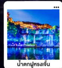
น้ำตกฝูหลงจิ้น

"มหัศจรรย์...จางเจียเจีย" | ดินแดนแห่งขุนเขาและสายน้ำ "เขาเกียนเหมินซาน" | ประตูดวง...ท่าอากาศยาน 999 ชั้น | นั่งรถไฟความเร็วสูง สัมผัสความสวยงามระบียงแก้ว "อุทยานอวตาร" | ส่องล่องกลางขุนเขา...ดั่งภาพฝันในห้วงนเจียเจีย | ช้อปปิ้ง POPMART "เมืองโบราณ" ฝูหลง" หยุตเวลา ณ เมืองบนม่านน้ำตก... | "เฟิ่งหวง" ล่องเรือชมชีวิตริมแม่น้ำทิวเจียง "นครฉางซา" ปิดท้ายความทันสมัย