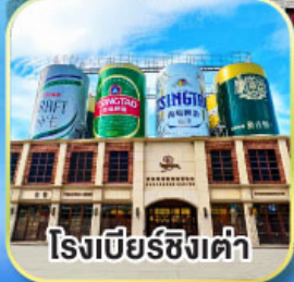
โรงแรมเบียร์ซิงเต่า