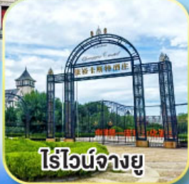
ไร่ไวน์จางยู