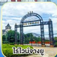
ไรไวน์จางยู