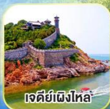
เจดีย์เฝิงไหล