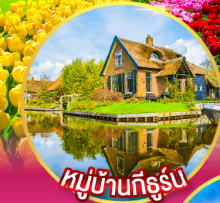
หมู่บ้านที่รูร์น