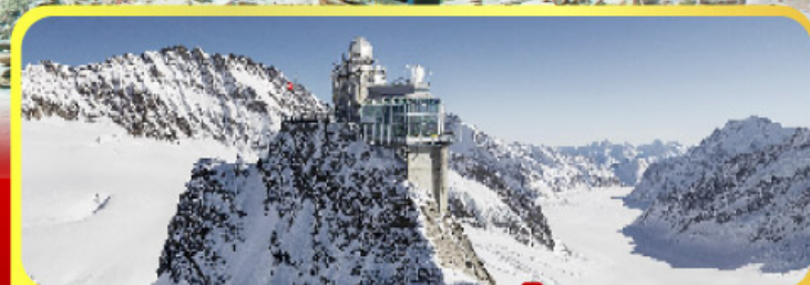
ยอดเทวาลุงเฟรา