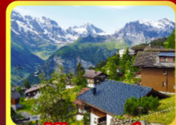
หมู่บ้านเมอร์ริล