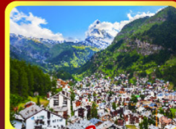
เชอร์แมนท์