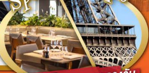
รับประทานอาหารกลางวัน บนหอไอเฟล

ไฮไลท์ในโปรแกรม • สะพานไม้ชาเปล ลูเซิร์น