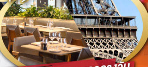
รับประทานอาหารกลางวัน บนหอคอยไอเฟล

ไฮไลท์ในโปรแกรม • ถ่ายรูปคู่อไอเฟลและพิพิธภัณฑลุลฟท์ • สะพานไม้ชาเปล ลูเซิร์น • ขึ้นกระเช้าสู่ยอดเขาจุงเฟรา • เมืองมรดกโลก กรุงเบิร์น • ถ่ายรูปปราสาทซิลยงที่มองเทรอซ • ศาลาไทย เมืองโลซานน์ • เดินเพลินๆ ณ เมืองเวเวย์