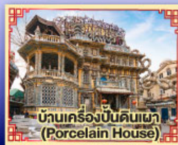
บ้านเครื่องปั้นดินเผา (Porcelain House)

มือพิเศษ.. เปิดปักกิ่ง, ปังย่างเกาหลี, สุกี้ Haidilao