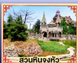
สวนหินจงหิว