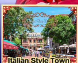
Italian Style Town