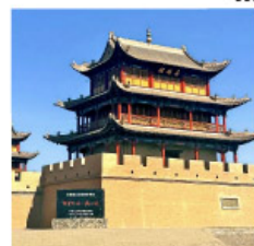
ถ้ำเพงเจียยี่กวน