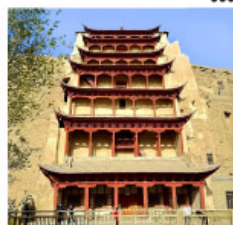
ถ้ำม่อเกา