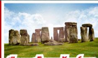
เยือนสโตนเฮ็นจ์ และ พิพิธภัณฑน์โรมันบาร