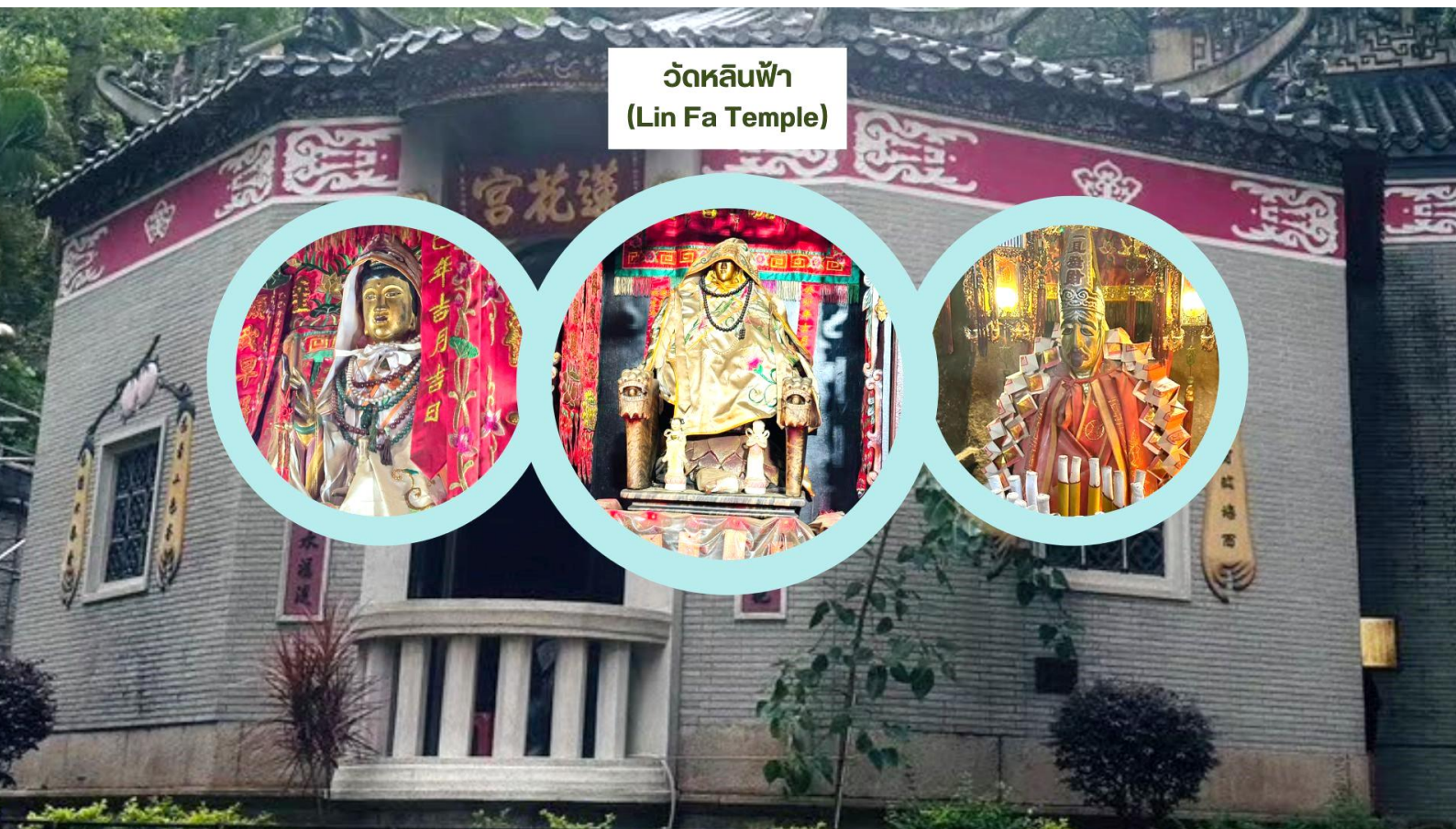
วัดหลินฟ้า (Lin Fa Temple)

เรียกว่ามาทีเดียวได้ขอพรกันครบเลย ไม่ว่าจะใครจะขอพรอันใดก็สมหวัง สมความปรารถนาทุกประการ