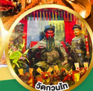
วัดกวนโก