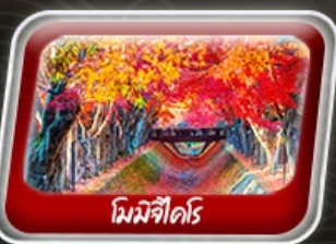
โมมิจิโคโร