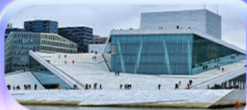
โอบุร่าฮาล์

07-15 ต.ค.69 / 16-24 ต.ค.69 13-21 พ.ย. 69 / 04-12 ธ.ค. 69 25 ธ.ค. 69 - 02 ม.ค. 70 (ปีใหม่)