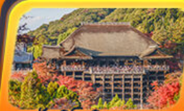
วัดคิโยมิสุเดระ