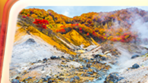
เขมเขานรกจิโศดามิ