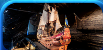
พิพิธภัณฑ์ทิวาชา

Scandinavian Lover Capital Sweden Norway Denmark