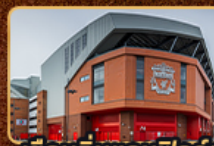
เขื่อนดินแอนฟิลด์และโอลด์แทรฟฟอร์ด