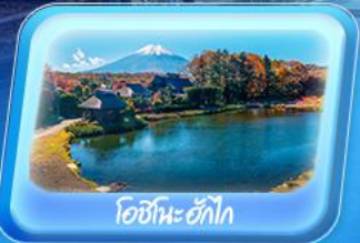
โอชิโนะอักษิ