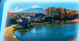
โอชิโนะฮักไก