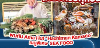
พบกับ Ama Hut "Haohiman Kamado" เมนูพิเศษ SEA FOOD