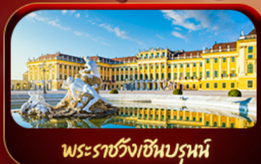
พระราชวังเซินบรูน์