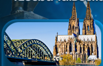
มทาวีซาร์โคโลญ