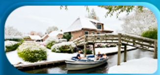
ล่องเรือชมหมู่บ้านทอร์น

พิเศษ ล่องเรือแม่น้ำเซน ชมเมือง โดย บาโต มูช