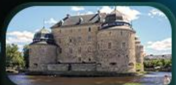
ปราสาทไอโรโบ

สต็อกโฮล์ม ไอโรโบ ออสโล ไอเดนเซ โคเปนเฮเกน