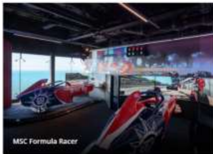
MSC Formula Racer