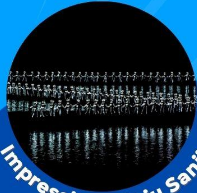
Impression of Liu Sanjie