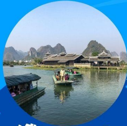
เมืองลับแล