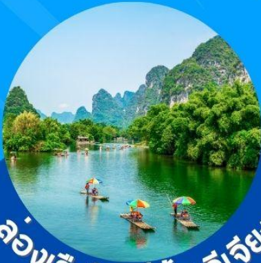
ล่องเรือในแม่น้ำหลีเจียง