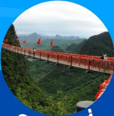
ภูเขาหลุย่