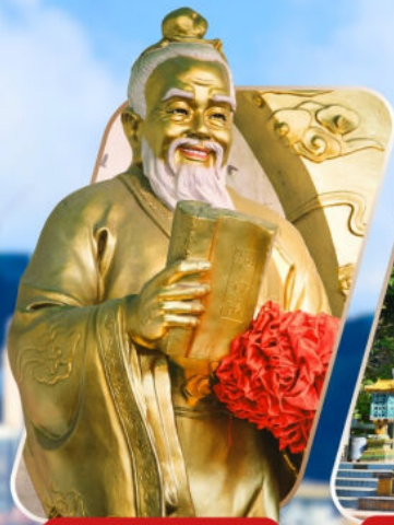
WONG TAI SIN