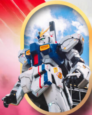
ห้างลาลาพอกกันดั้ม