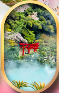
อุมิจิโกกุ