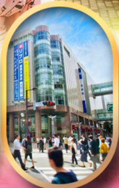
ช้อปปิ้งย่านเท็นจิน