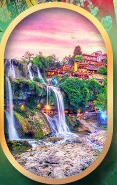
ฟูหลงเจิ้นน้ำตก