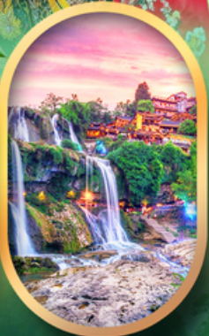
ฟูหลงเจินน้ำตก