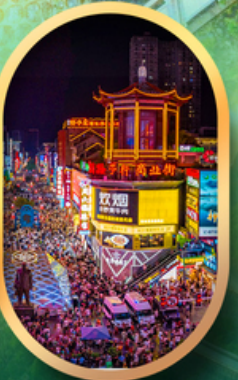
ถนนคนเดินซิงลู่