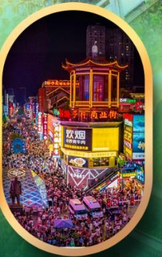
ถนนคนเดินชิงลู่