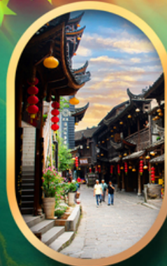
เมืองโบราณฟูหลงเจิน