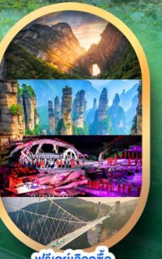
ฟรีเคย์เลือกซื้อ Option เสริม