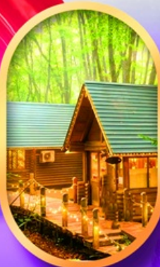
นิงเกิลเกอเรส