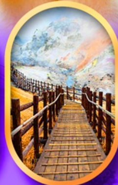
จิกุคคาบิ