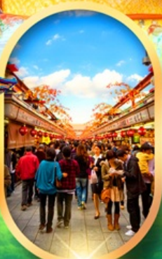
ถนนนากามิเสะ