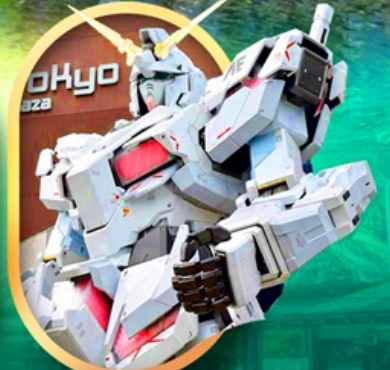
ห้างไอโดะกันดั้ม