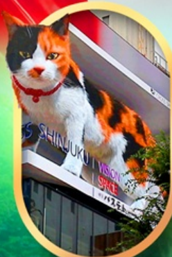
ช้อปปิ้งชินจุกุ