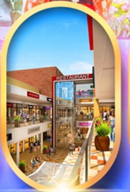
มิตซึเอะอิเกะอิ