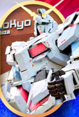
ห้างไอโดะบะกันดั้ม