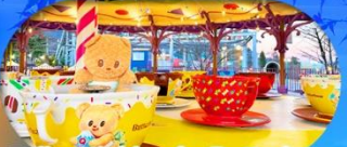
Fuji q Highland x Butterbear เดินทาง พ.ค. 69 เป็นต้นไป