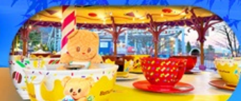
Fuji q Highland x Butterbear เดินทาง พ.ศ. 69 เป็นต้นไป