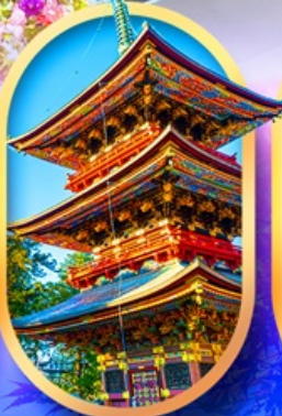
วัดนาริตะซัน