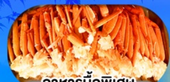
อาหารมือพิเศษ บุฟเฟ่ต์งาปู