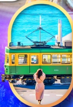
ถนนโคมาจิโคริ