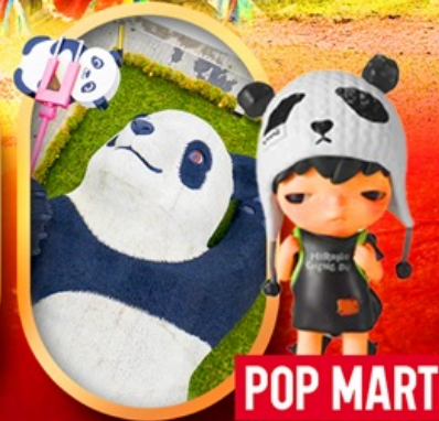
หมีแพนด้าเซลฟี