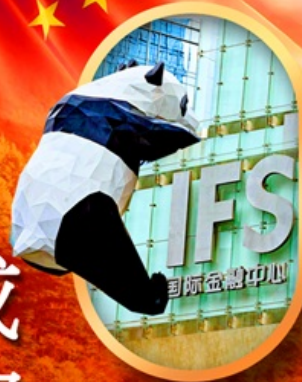
IFS หมีแพนด้าป็นติก