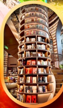
อุทยานปี้เฉิงโกว