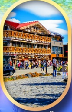
ภูเขาไฟฟูจิ ชั้น 5