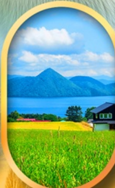
ทะเลสาบโทโยะ