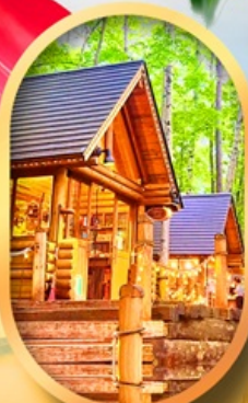
นิงเกิ้ลเกออส