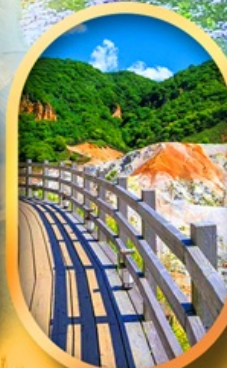
โนโบริเบ็ทสึ