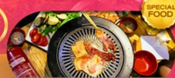
พิเศษเมนู BBQ Buffet เดินทาง มี.ค. - ต.ค. 69