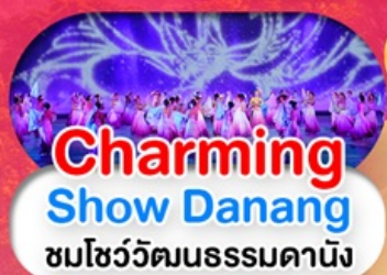
Charming Show Danang ชมโชว์วัฒนธรรมดานัง