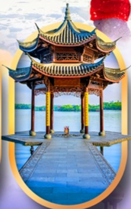
ล่องทะเลสาบซีหู