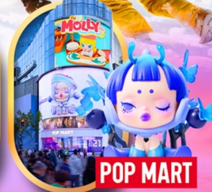
ถนนหนานจิง