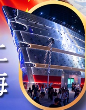
เรือคอะทูลยส์