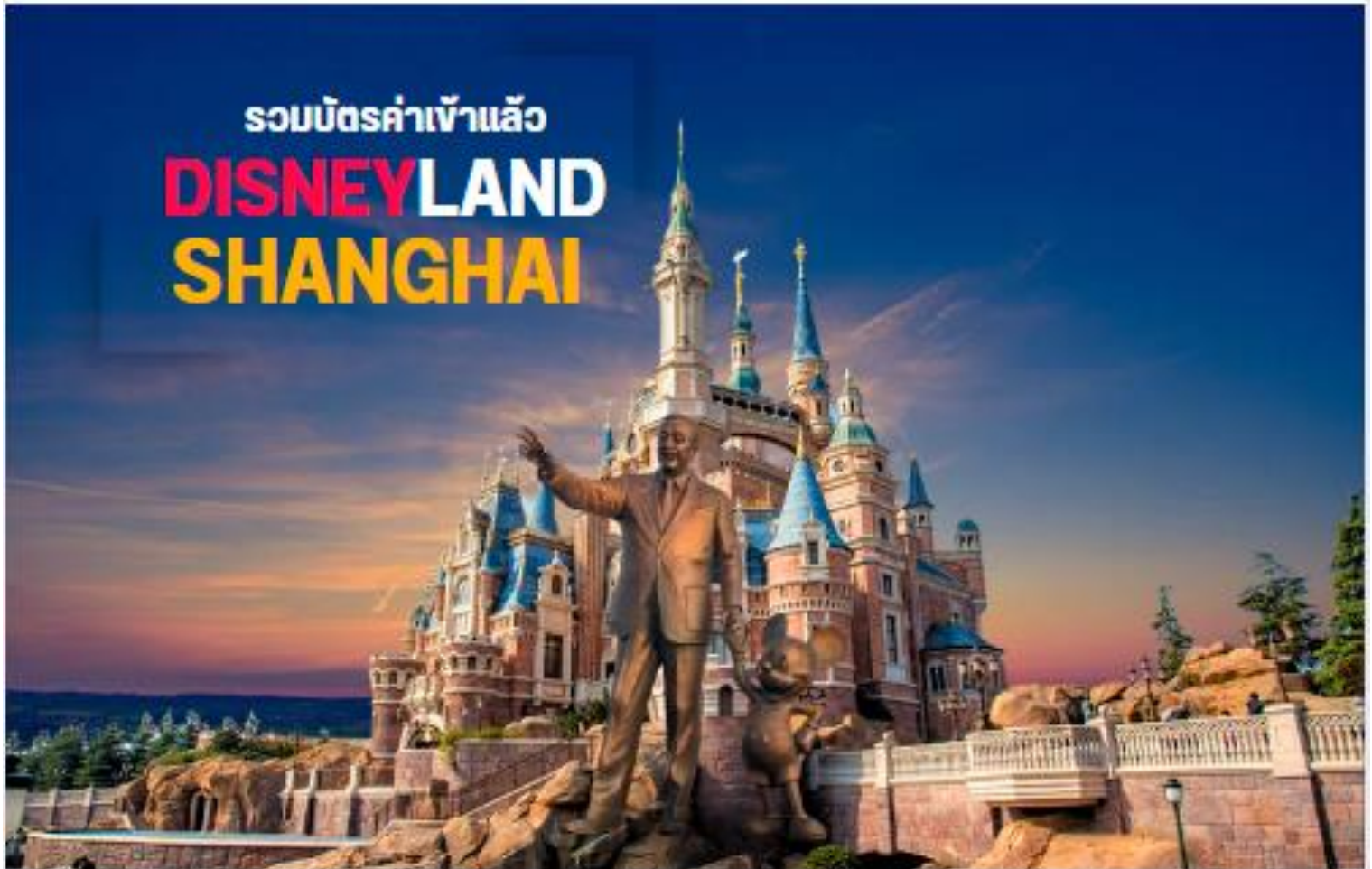
DISNEYLAND SHANGHAI ดิสนีย์แลนด์เชียงใหม่

ไม่เข้าสวนสนุก DISNEY LAND หักออก 2,000 บาท