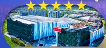
Crowne Plaza Snow World Hotel หรือเทียบเท่า S-คีย์ 5 ดาว 1 คืน

เชียงใหม่ ดิสนีย์แลนด์ ไอซ์แอนดส์โนวเวิลด์