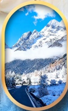
อุทยานสี่ครุณี