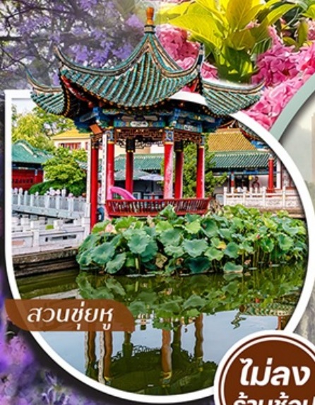
สวนชื่อยู่