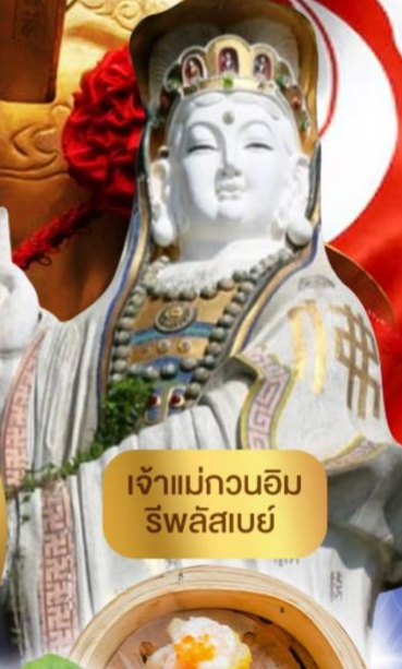
เจ้าแม่กวนอิม ริฟลิสเบย์