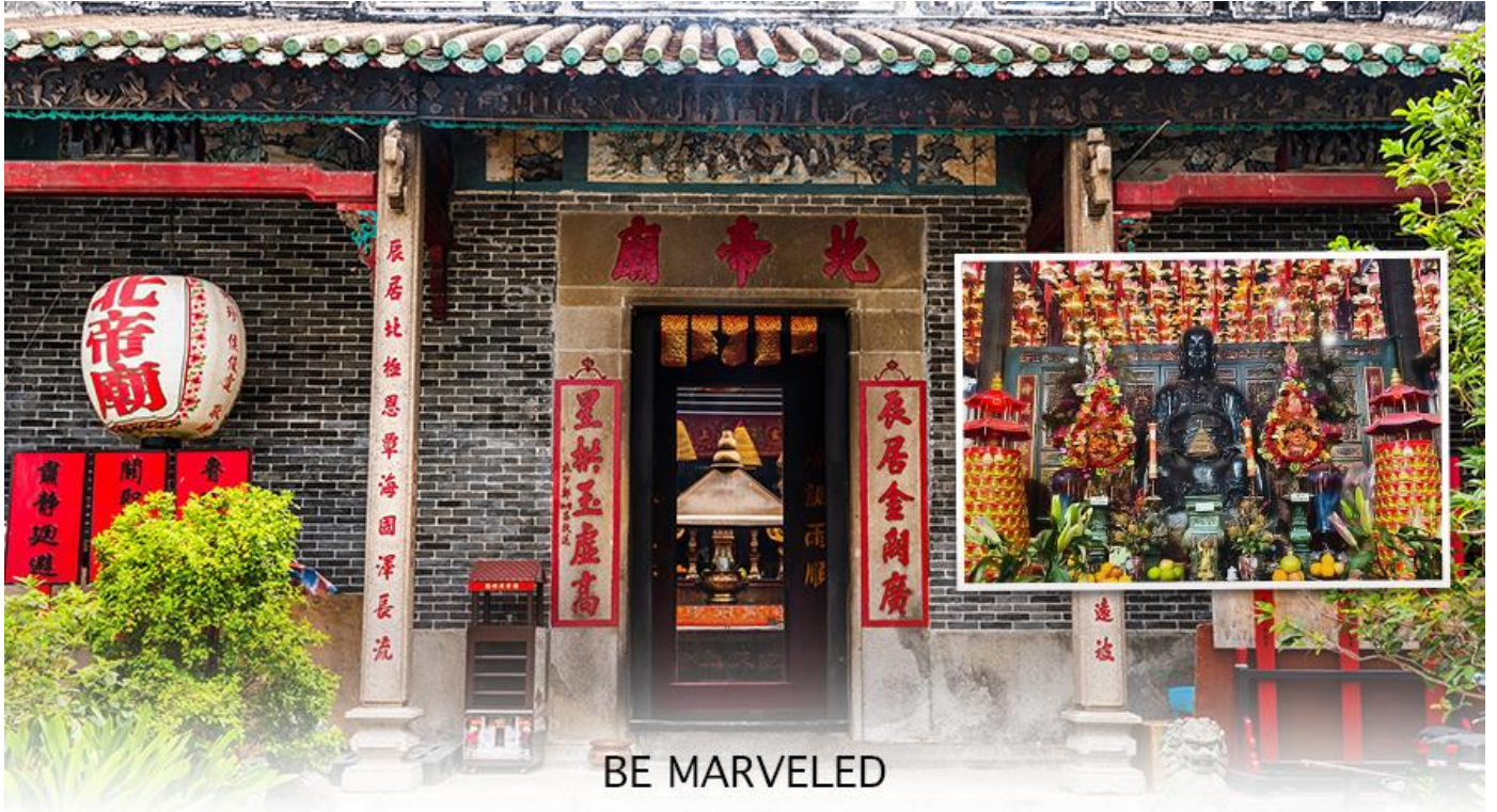
BE MARVELED วัดปักไต้

จากนั้นนำท่าน ช้อปปิ้ง ย่านจิมซาจุ่ย เป็นแหล่งช้อปปิ้งชื่อดัง มีร้านขายของทั้งเครื่องหนัง, เครื่องกีฬา, เครื่องใช้ไฟฟ้า, กล้องถ่ายรูป, อุปกรณ์อิเล็กทรอนิกส์และสินค้าแบบที่เป็นของพื้นเมืองฮ่องกงอยู่ด้วย อีกทั้งสินค้าแบรนด์เนม รวมถึงร้านอาหาร ตั้งอยู่บนถนนนาธาน ถนนทอดยาวตั้งแต่จิมซาจุ่ย จนถึงย่านปรีนซ์เอ็ดเวิร์ด เต็มไปด้วยร้านค้าต่างๆมากมาย ทั้งเสื้อผ้าแบรนด์เนมระดับ HI-END ชื่อดังทั่วโลก ห้างสรรพสินค้าที่ทันสมัย จากถนน นาธานไปที่ถนนแคนตัน ท่านจะตื่นตาตื่นใจไปกับเอาต์เล็ตแบรนด์ที่เรียงติดกันเป็นแถบ นอกจากนี้ยังมี HARBOUR CITY ศูนย์การค้ายักษ์ใหญ่ของฮ่องกง ซึ่งมีร้านค้ากว่า 450 ร้านรวมอยู่ที่นี้ และมี SHOPPING COMPLEX ขนาดใหญ่ชื่อ OCEAN TERMINAL ซึ่งประกอบไปด้วยห้างสรรพสินค้าเรียงรายกันอยู่ และมีทางเชื่อม ติดต่อกันสามารถเดินทะลุถึงกันได้ มีสินค้าแบรนด์ดัง ไม่ว่าจะเป็น GIORDANO, BOSSINI, COACH, LONGCHAMP, LOUIS VUITTON, PRADA, HEMES และอีกมากมายให้ท่านได้เลือกซื้อ