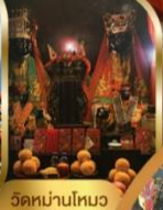
วัดบ้านใหม่