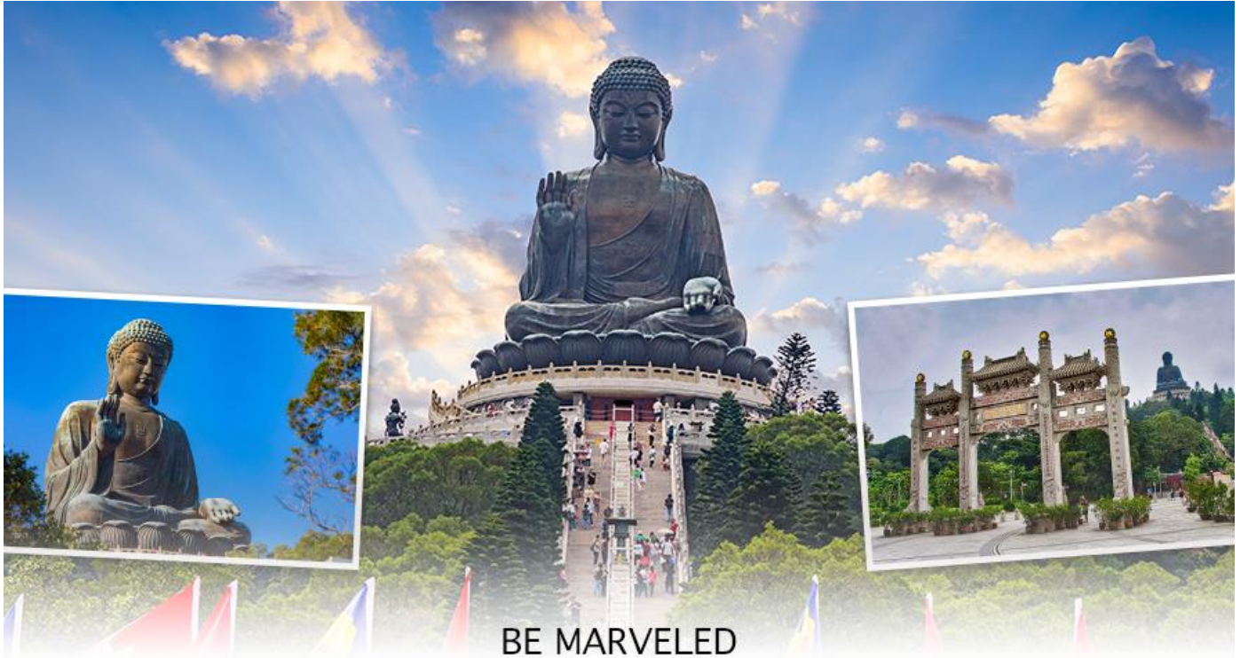
BE MARVELED พระใหญ่เทียนถาน

☉ อีศระอาหารเย็น เพื่อความสะดวกในการช้อปปิ้ง