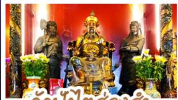
วัดปุกโกตฮ่องฮ่า

นั่งกระเช้าเองปิงสักการะพระใหญ่เทียนถาน • ขอพรองค์เซกง โชคลาก การเงินและธุรกิจ เทพเจ้าปิงไต่ฮ่องฮ่า ขอพรเรื่องความสำเร็จในชีวิตและการทำงาน • วัดหวังต้าเซียน สักการะสิ่งศักดิ์สิทธิ์ เสริมมงคลชีวิต • เจ้าแม่กวนอิมฮ่องฮ่า ขอเรื่องเงิน ทรัพย์สิน และความมั่งคั่ง • อิศระท่องเที่ยว 2 วัน เลือกซื้อบัตรคัสซีนีแพลนคหรือซ้อปเซ็กๆ