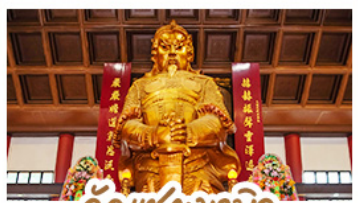
วัดเซกงเมิว