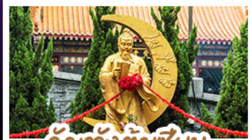
วัดแหว่งต้าเซียน