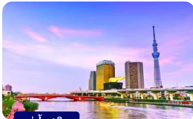
แม่น้ำสุมิดะ

ส่วนไฮไลต์สำคัญของวัดนี้คือ ไตคอน หรือหัวไข่เต่า สัญลักษณ์ศักดิ์สิทธิ์ คนที่นี้เชื่อว่าไตคอนช่วย "ชำระล้างสิ่งไม่ดี" และนำโชคลาภเข้ามา นักท่องเที่ยวมักนำไตคอนไปถวายเพื่อขอพร