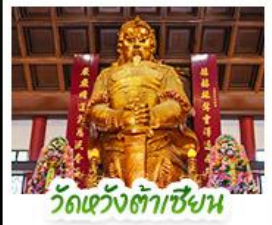
วัดหวังต้าเซียง

พัก 4 ดาว ย่านช้อปปิ้งจิมซาจуйหรือย่านมงก๊ก สนุกสนานไปกับสวนสนุกดิสนีย์แลนด์แบบเต็มวัน (รวมรถรับ-ส่ง) วิวหวังต้าเซียน วิวพรต่านสูงภาพ • วิวเซกทงหิว วิวพรโชคลาก การเงินและธุรกิจ • เจ้าแม่ทวนอิมฮ่องฮ่า นมัสการองค์เจ้าแม่ทวนอิม ที่มีอายุกว่า 600 ปี • นั่งกระเช้าเองปีงสักการะพระใหญ่เทียนถาน