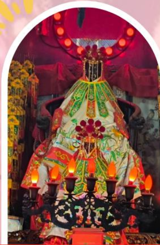
วัดเจ้าแม่กวนอิมฮ่องกง ขอพรเรื่องเงิน ทรัพย์สิน และความมั่งคั่ง