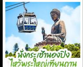
นั่งกระเช้าเองปีง ใจวัดพระใหญ่เทียนถาน