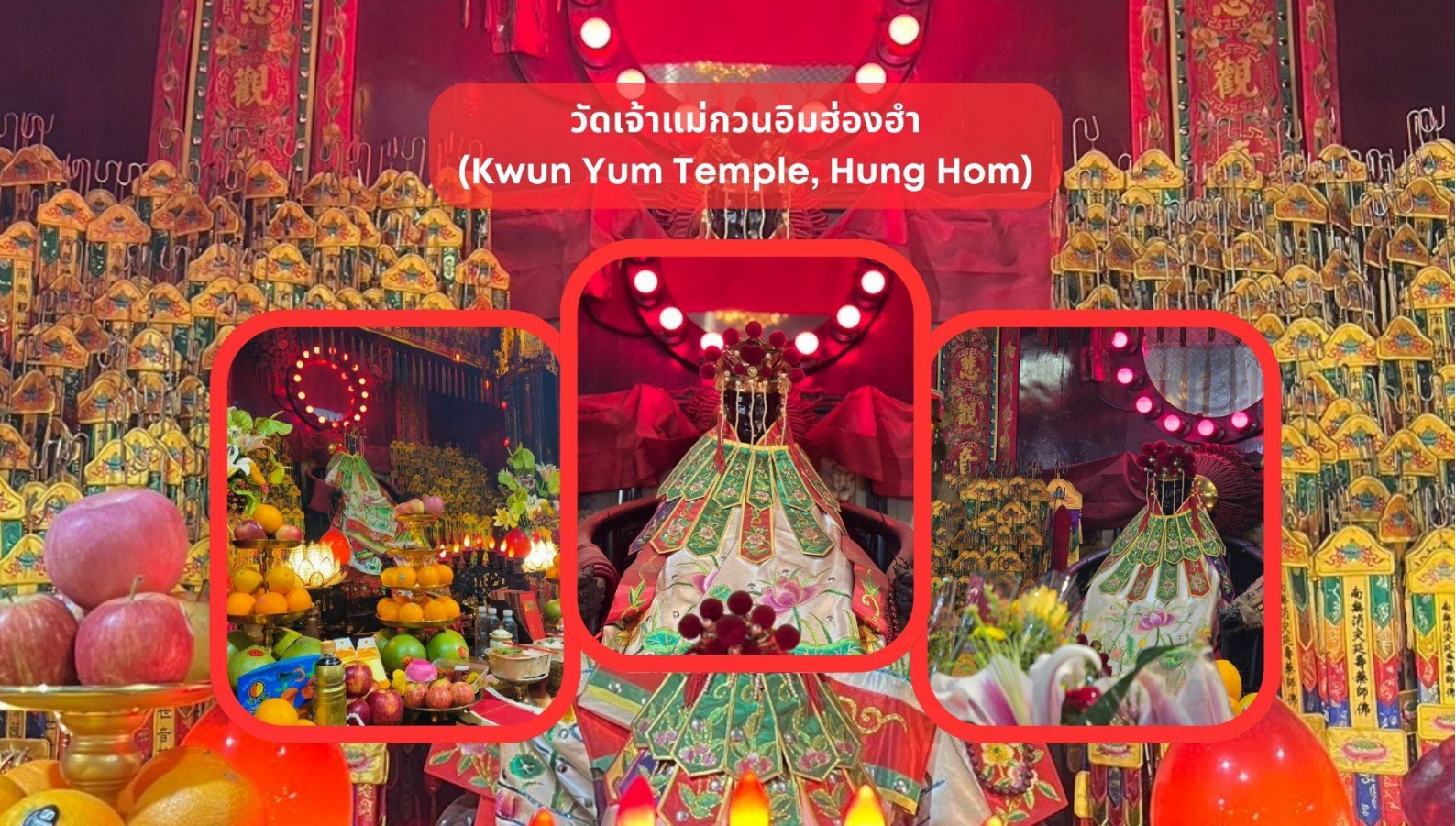
วัดเจ้าแม่กวนอิมฮ่องกง (Kwun Yum Temple, Hung Hom)

รับประทานอาหารเช้า ณ ภัตตาคาร บริการท่านด้วยเมนูติ่มซำฮ่องกง (มื้อที่ 3)