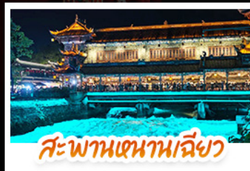
สะพานเจ้านานเฉียว