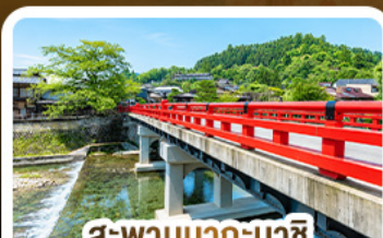
สะพานนากะบาชิ ทาดายาม่า