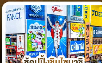
ช้อปปิ้งชินโซบาชิ และโดตงโมริ