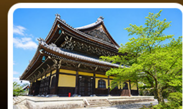
วัดนินเซ็นจิ