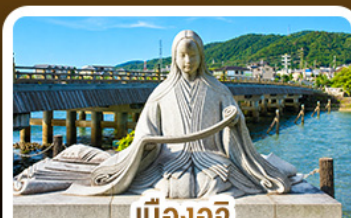
เมืองอูจิ สวรรค์คนรักชาเขียว