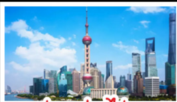
ถ่ายรูปตอไข่มุก