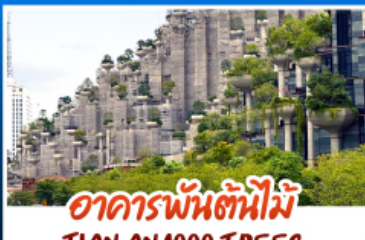
อาคารพันต้นไม้มือ TIAN AN 1000 TREES