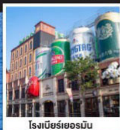
โรงแรมริเวอร์มัม